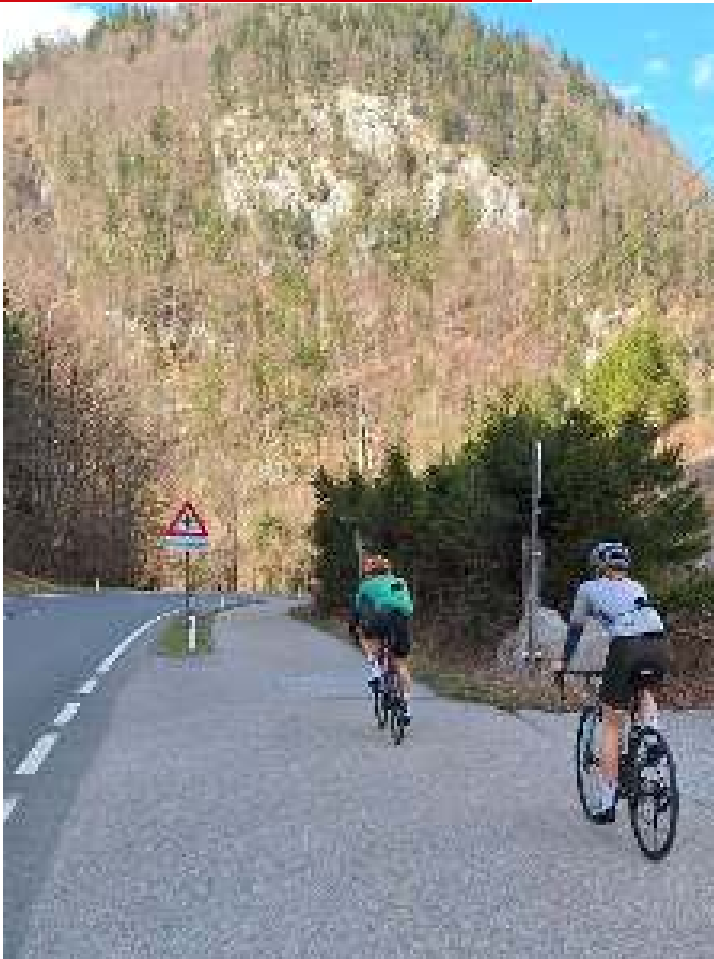
GRW Lammeröfen (Scheffau)