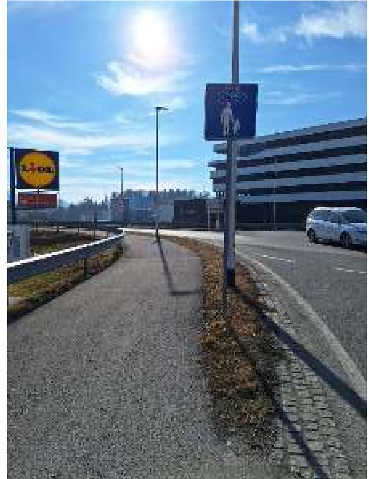
GRW Fischachbrücke (Seekirchen)