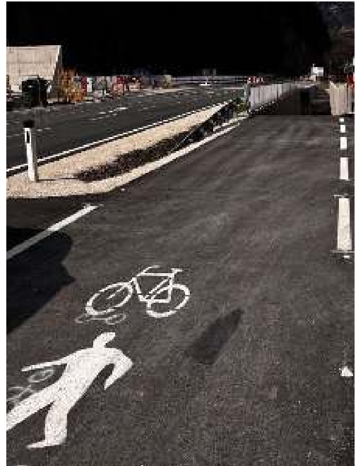
GRW-Unterführung Kniepass (Unken)