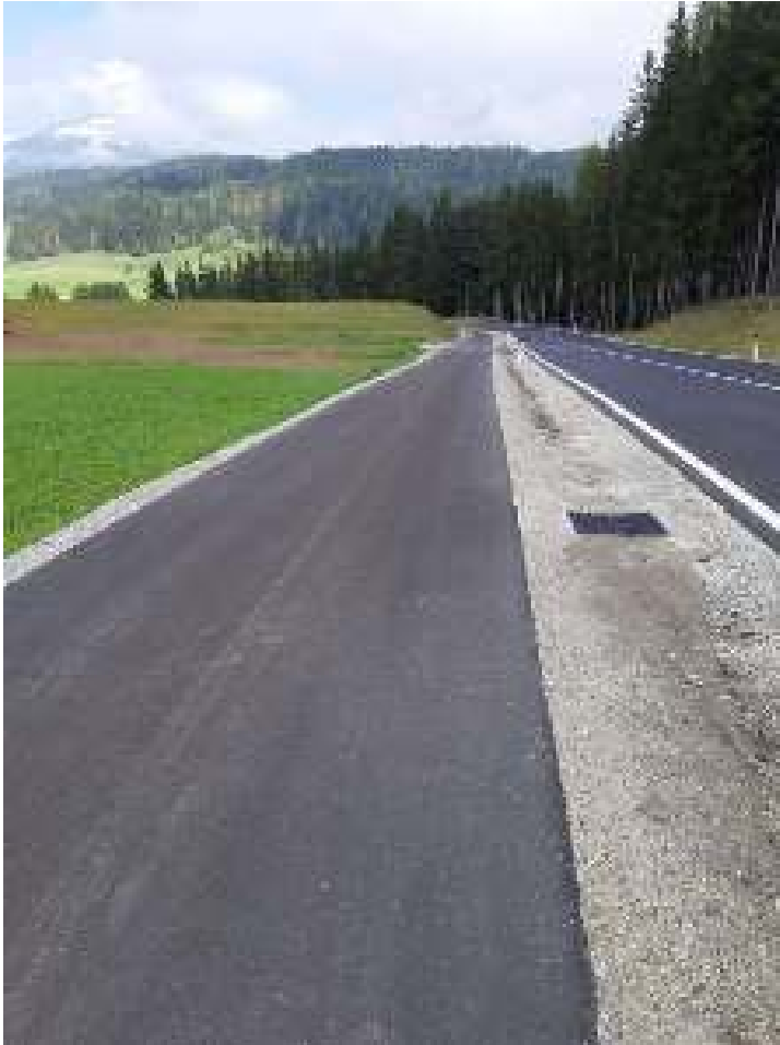
GRW Lintsching (St. Andrä)