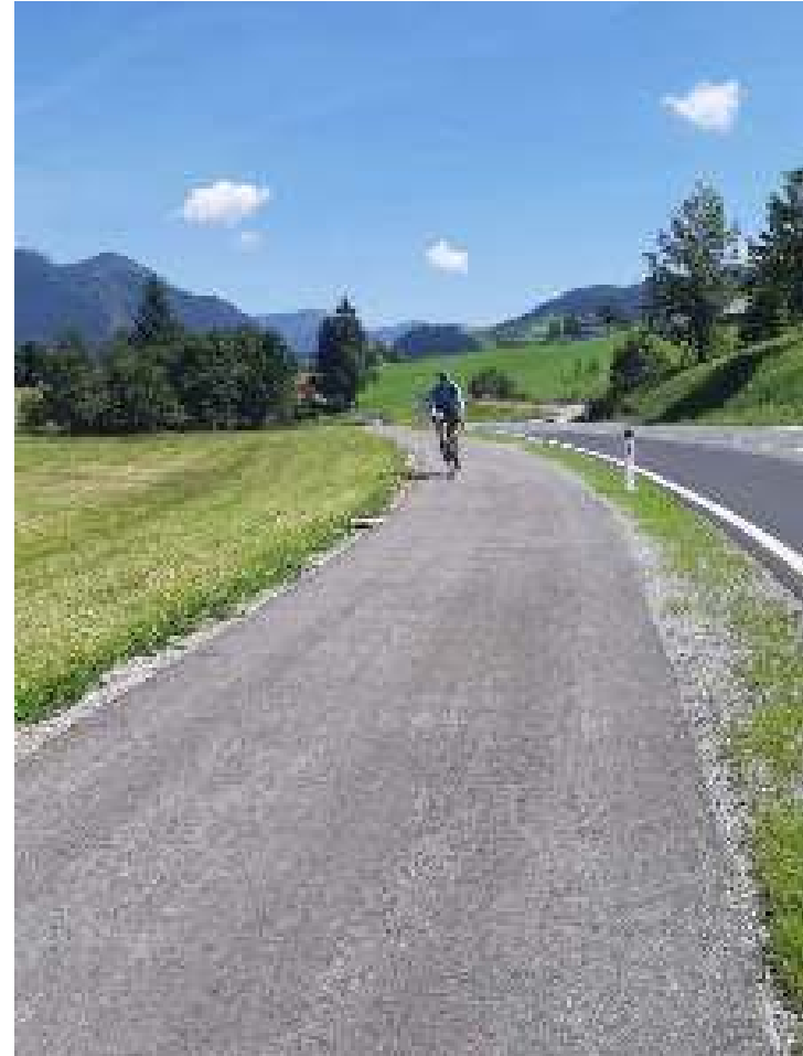
GRW Schöner (Abtenau)