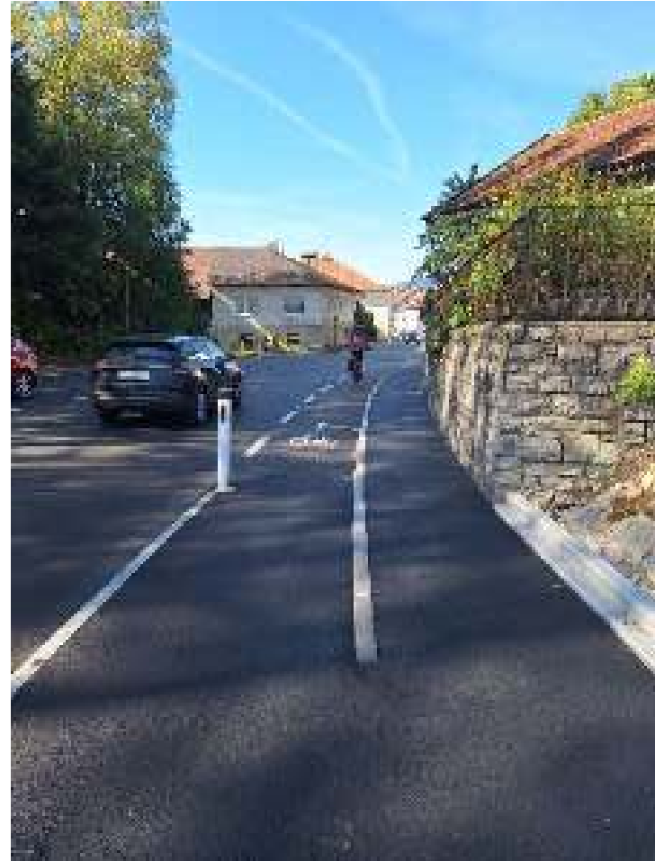
GRW Breinberg (Straßwalchen)