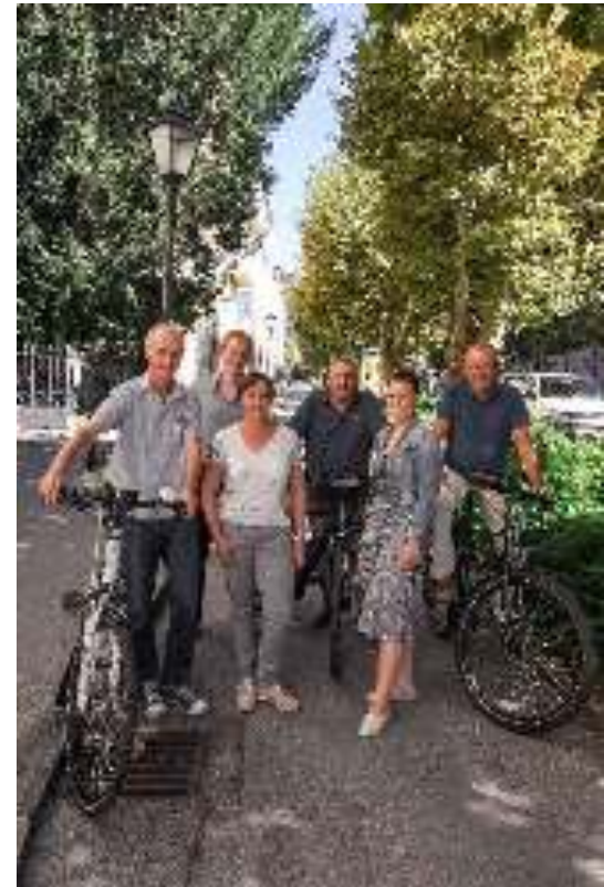
Das neue Radverkehrsteam der Stadt Salzburg