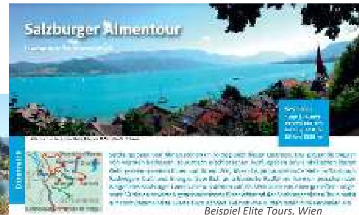
Beispiel Elite Tours, Wien