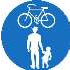
Geh- und Radweg ( gemeinsam geführter Weg )