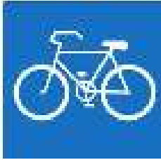
Radweg ohne Benutzungspflicht

Radwege die mit einem rechteckigen Verkehrszeichen gekennzeichnet sind, dürfen von Radfahrenden benutzt werden, müssen aber nicht. Dadurch sollen für Radfahrende gefährliche Situationen am Radweg entschärft werden (z.B. Queren, weil der Radweg einmal links und dann rechts der Fahrbahn geführt ist bzw. bei schmalen Geh- und