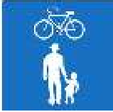
Geh- und Radweg ohne Benutzungspflicht (gemeinsam)