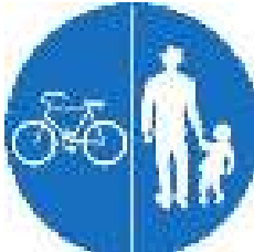
Geh- und Radweg ( getrennt geführter Weg )